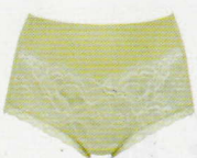
PFA111 ¥3,850(税込) ~