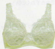
BFA311 (フルカップ) ¥7,480(税込) ~