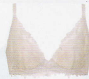
BFA416 ¥8,580(税込) ~