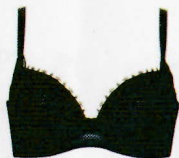
BFA709 ¥9,460(税込) ~