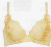
BFA435 ¥9,240(税込) ~