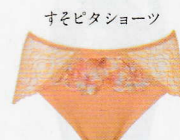
すそビタショーツ