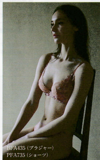
BFA435 (ブラジャー) PFA735 (ショーツ)