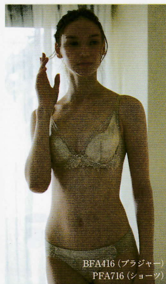
BFA416 (ブラジャー) PFA716 (ショーツ)