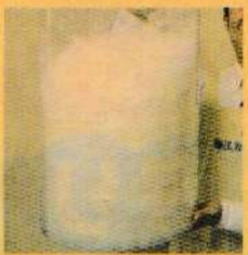
40グラムの足し羽毛です

大型の親鳥から採取した最高級の手摘み羽毛です。 かさ高、保温性に優れ、圧縮回復性に優れています。