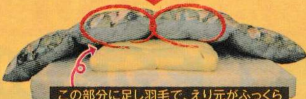
この部分に足し羽毛で、えり元がふっくら えり元に40グラムを足し羽毛後