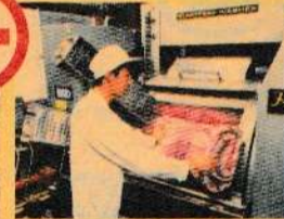
おふとんの丸洗い作業