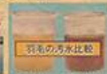
羽毛の汚れ水比較