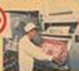
おとんと人の洗濯機で洗う