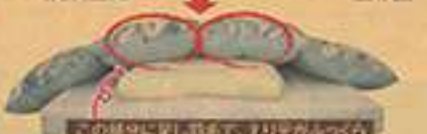
この部分に羽毛を足して、ふっくらとします