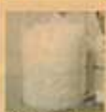
40グラムの羽毛を足す