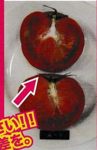
直径1mm程度のカビが 5、6箇所発生