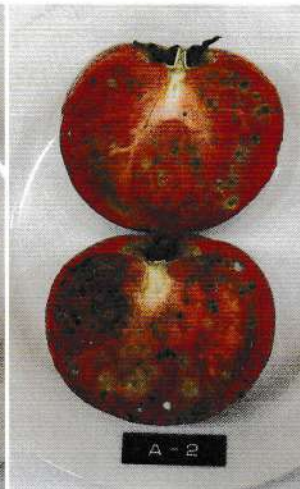
直径1~5mm程度 のカビが全体に広がる