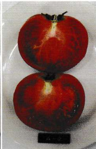
直径1mm程度のカビ が3、4カ所発生