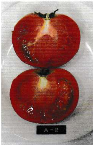
やや乾燥してくる