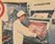
お布団の水洗い作業