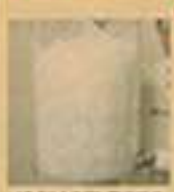
40グラムの羽毛を足す