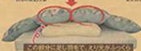
この部分に乾燥機を使用してふし詰め作業を行います